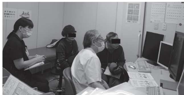
がん看護専門看護師同伴での術前説明風景