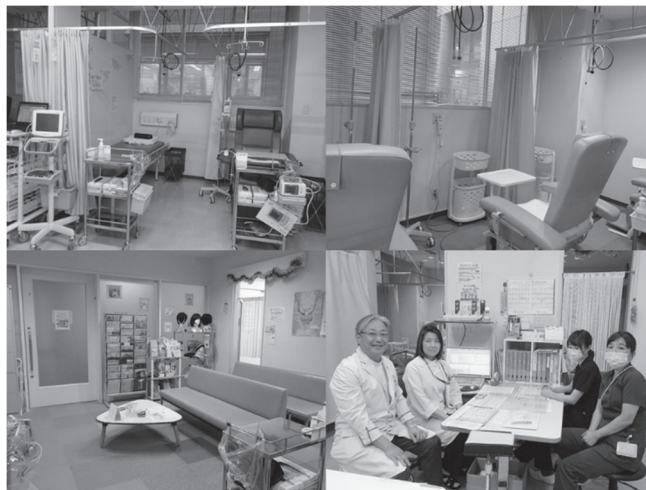
外来化学療法室でのカンファレンスと実際の化療室内