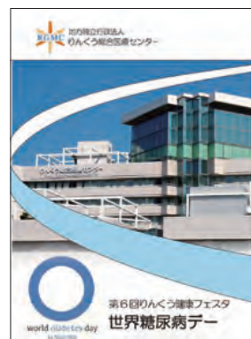
2022年健康フェスタ冊子