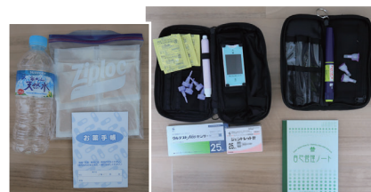
(写真左) 薬(1週間分が Good!) 水、お薬手帳 (写真右) 血糖測定器具 インスリン 血糖管理ノート