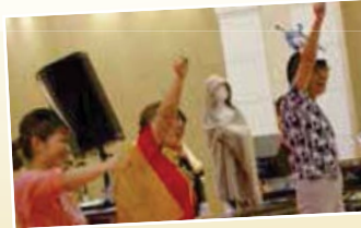
▲参加のお子さんたちと アンパンマン体操