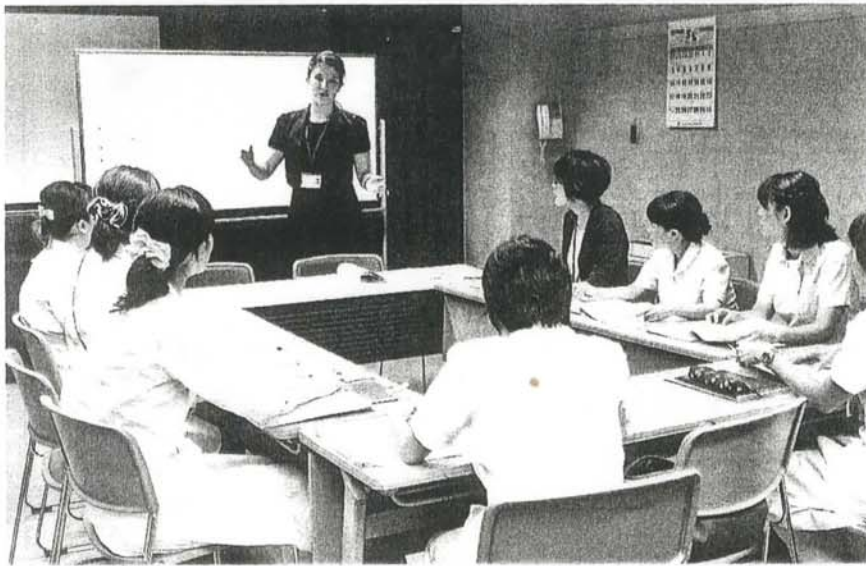
外国人講師から語学研修を受ける看護師や薬剤師ら。8月、東京都渋谷区の都立広尾病院

日本語ができない患者が安心して治療を受けられるよう支援する医療通訳の活躍が期待されている。日本を訪れる外国人が増え、2020年の東京五輪開催を控えて需要が高まるのは確実だ。積極的に取り組む病院があるほか、国や東京都も対応に乗り出した。